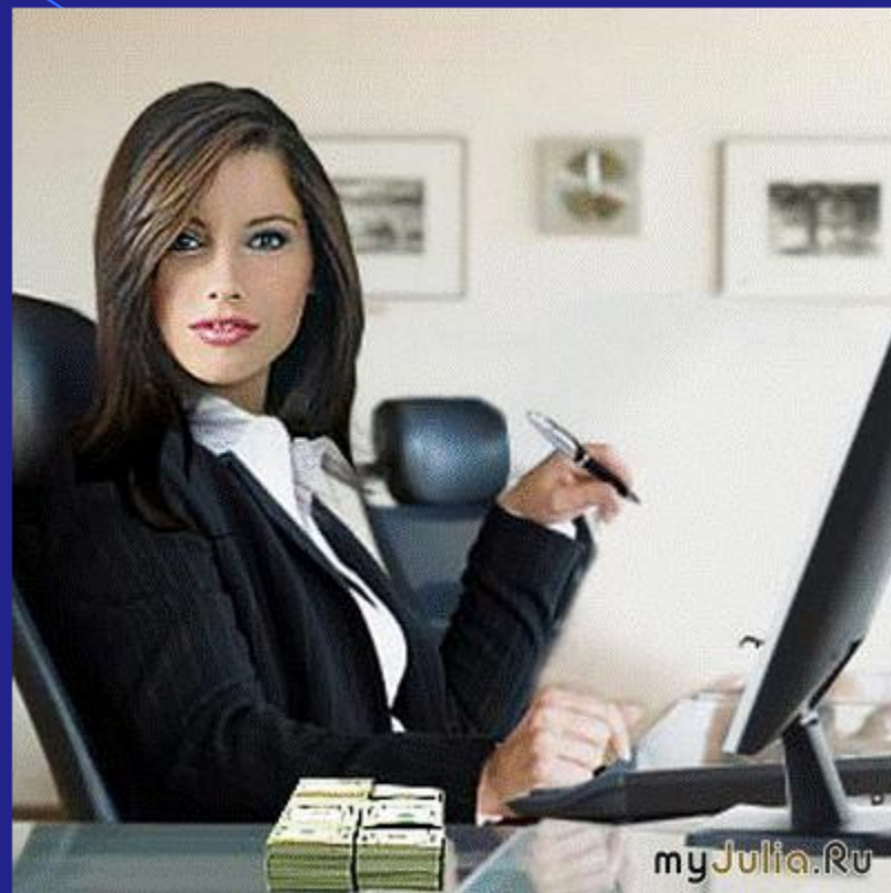
Шеф реабілітаційної фірми