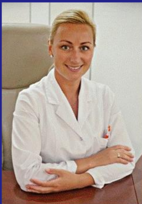
Фахівець з фізичної терапії