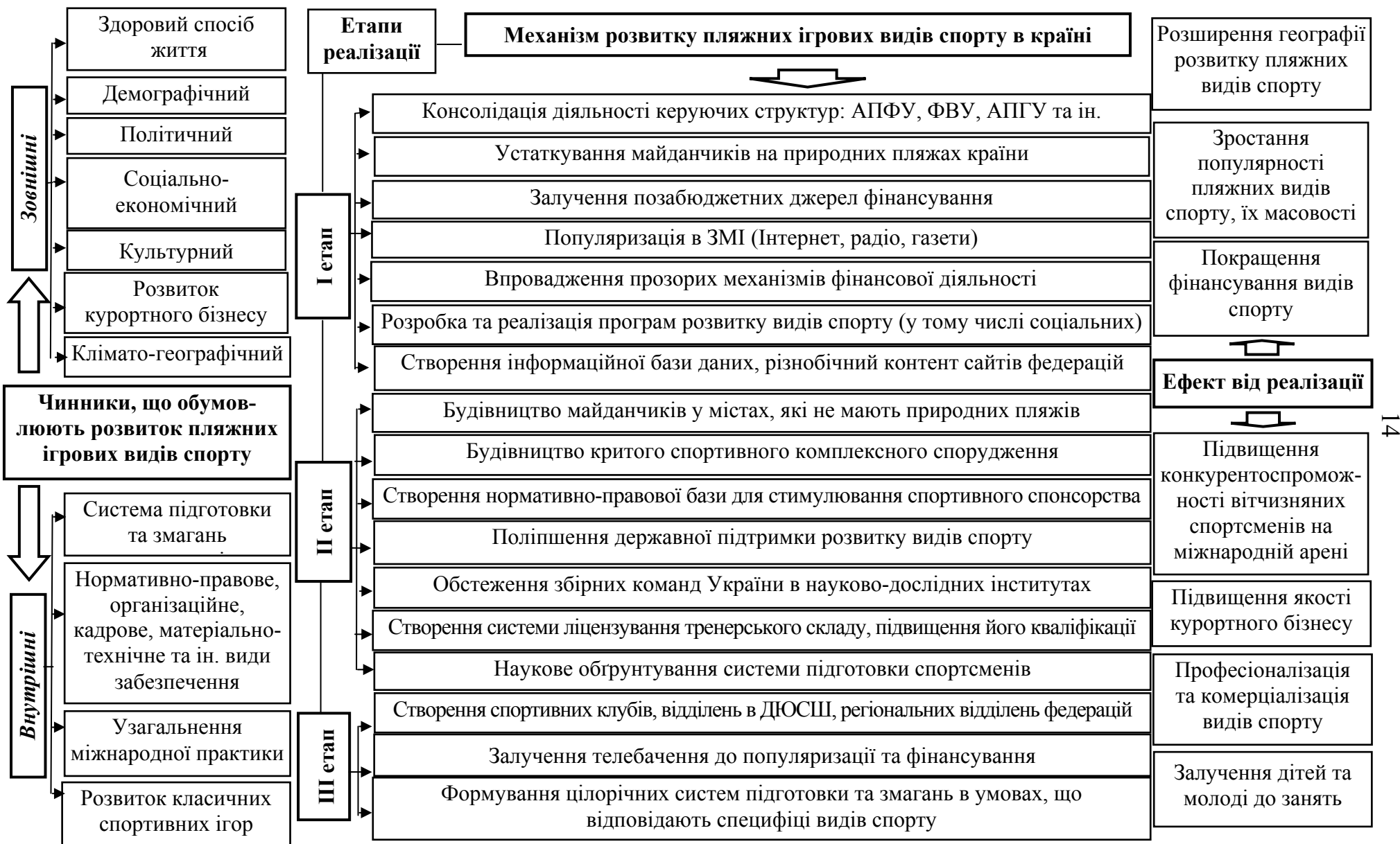
Рис. 2. Модель розвитку пляжних ігрових видів спорту в Україні