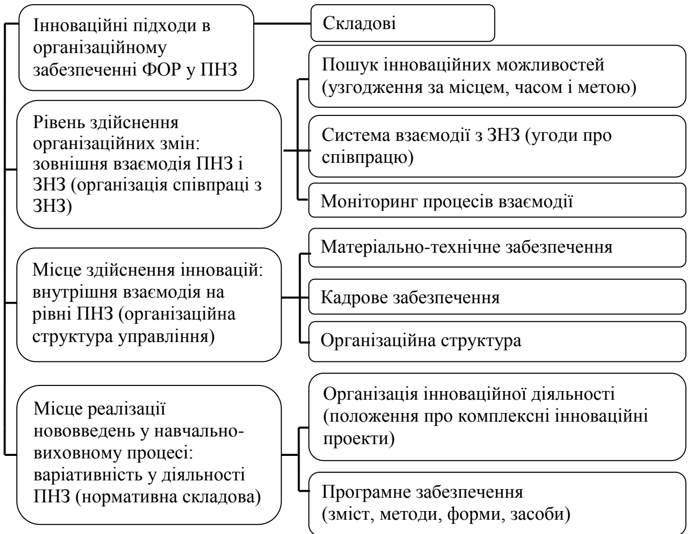
Рис. 2 Складові інноваційних підходів в організаційному забезпеченні фізкультурно-оздоровчої роботи у позашкільних навчальних закладах

ПНЗ є також варіативність у діяльності ПНЗ, що забезпечується резервом у побудові навчальних програм і можливістю введення оздоровчих знань в гуртки різних напрямів (рис. 2).