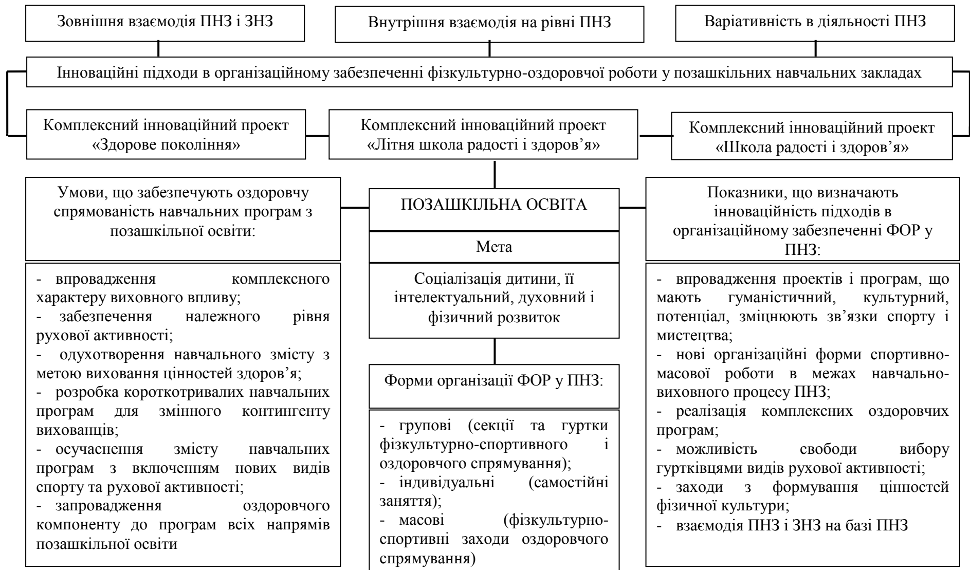
Рис. 3 Механізм реалізації інноваційних підходів в організаційному забезпеченні фізкультурно-оздоровчої роботи у позашкільних навчальних закладах