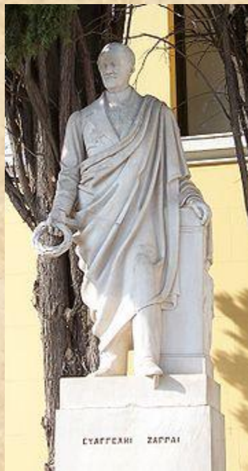
Євангеліс Заппас (1800 - 1865)