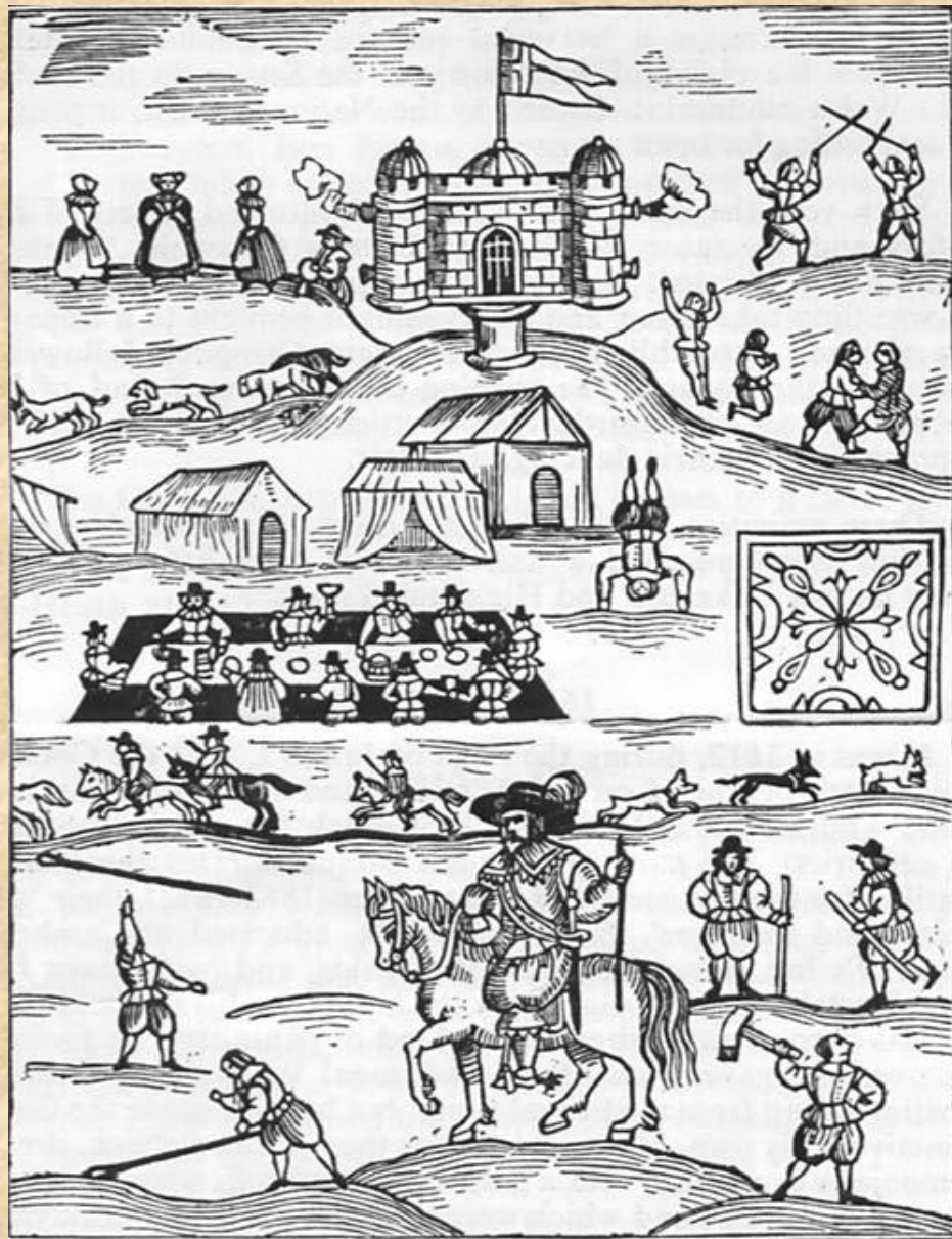
Зображення Олімпійських ігор, що проводив Роберт Дувр, 1612 р.