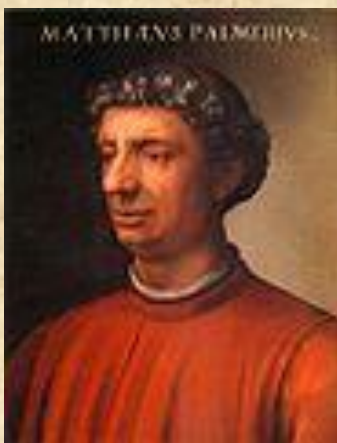
Матео Палмієрі (1405-1475 )