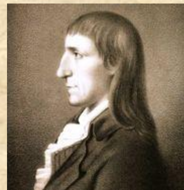
Іоган Крістоф Фрідерік Гутс-Мутс (1759- 1839)