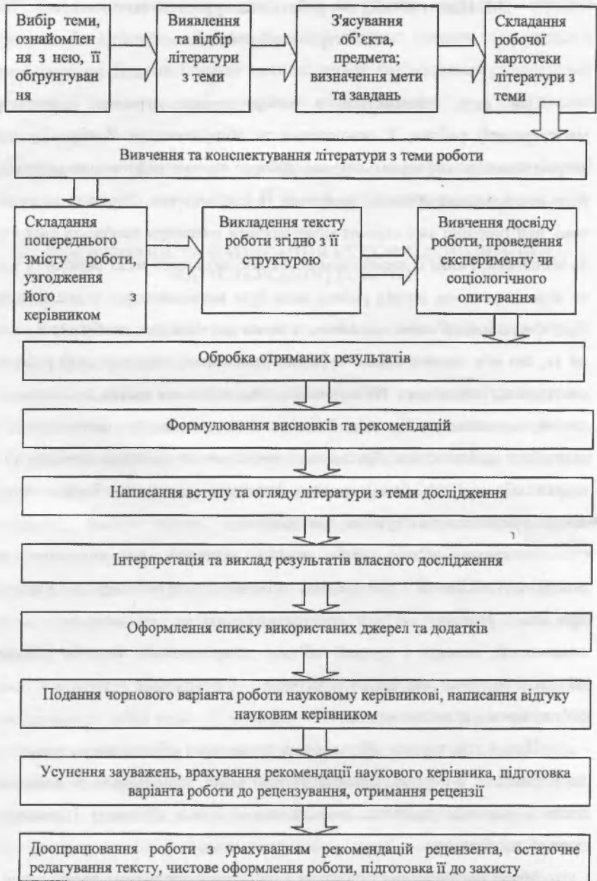
Рис. 3.1 Алгоритм написання курсової (дипломної, магістерської) роботи